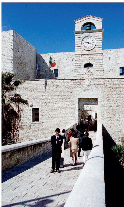
Il castello di Trani

Direttore artistico di questa rassegna la barlettana