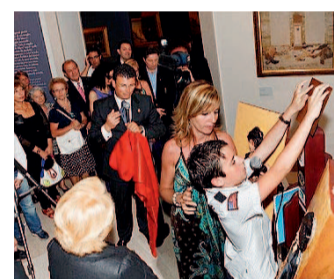
Opera tattile a palazzo della Marra